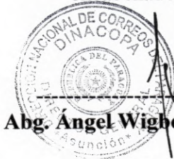
Abg. Angel Wigherto Pintos Balbuena