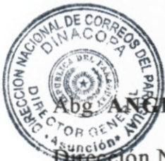
Abg. ANGEL W. PINTOS BALBUENA Director General Dirección Nacional de Correos del Paraguay

En prueba de conformidad y aceptación, firman las partes el presente convenio en la ciudad de Asunción, Capital de la República del Paraguay, a los 10 días del mes de abril de 2014, en 2 (dos) ejemplares de un mismo tenor y a un solo efecto.-----