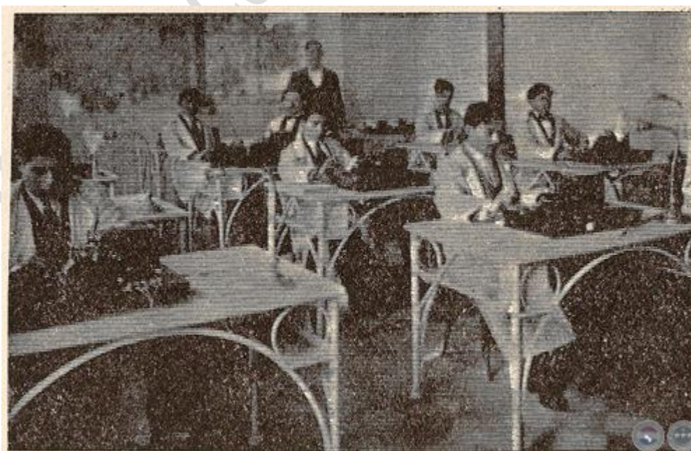
Un aspecto de la Sala de Transmisión de la Central de Telégrafos.