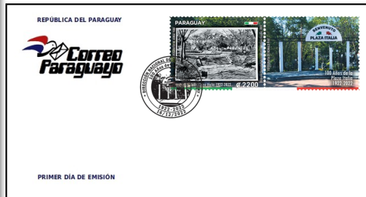
Cover and postmark of the first day: Gs. 3.700

Issue: 100 Years of Plaza Italia 1922-2022 Date of issue: 16/12/2022 Denomination & quantity: Gs. 2.200 – 5.000 stamps Paper: 90 gram gumed paper Sheet composition: 10 stamps x Gs.2.200 each Perforation: 13,5 Size: 4,5 x 3,5 cm Printing method: Offset. Color: Multicolor Printed in: Fiscal Values Department Asunción – Paraguay Decree: 8028/2022 Resolution: 1814/2022/DG/SG/AF General Direction: Abg. Luis Fernando Servín Colmán Coordination: Lic. Nilda Marlene Ríos